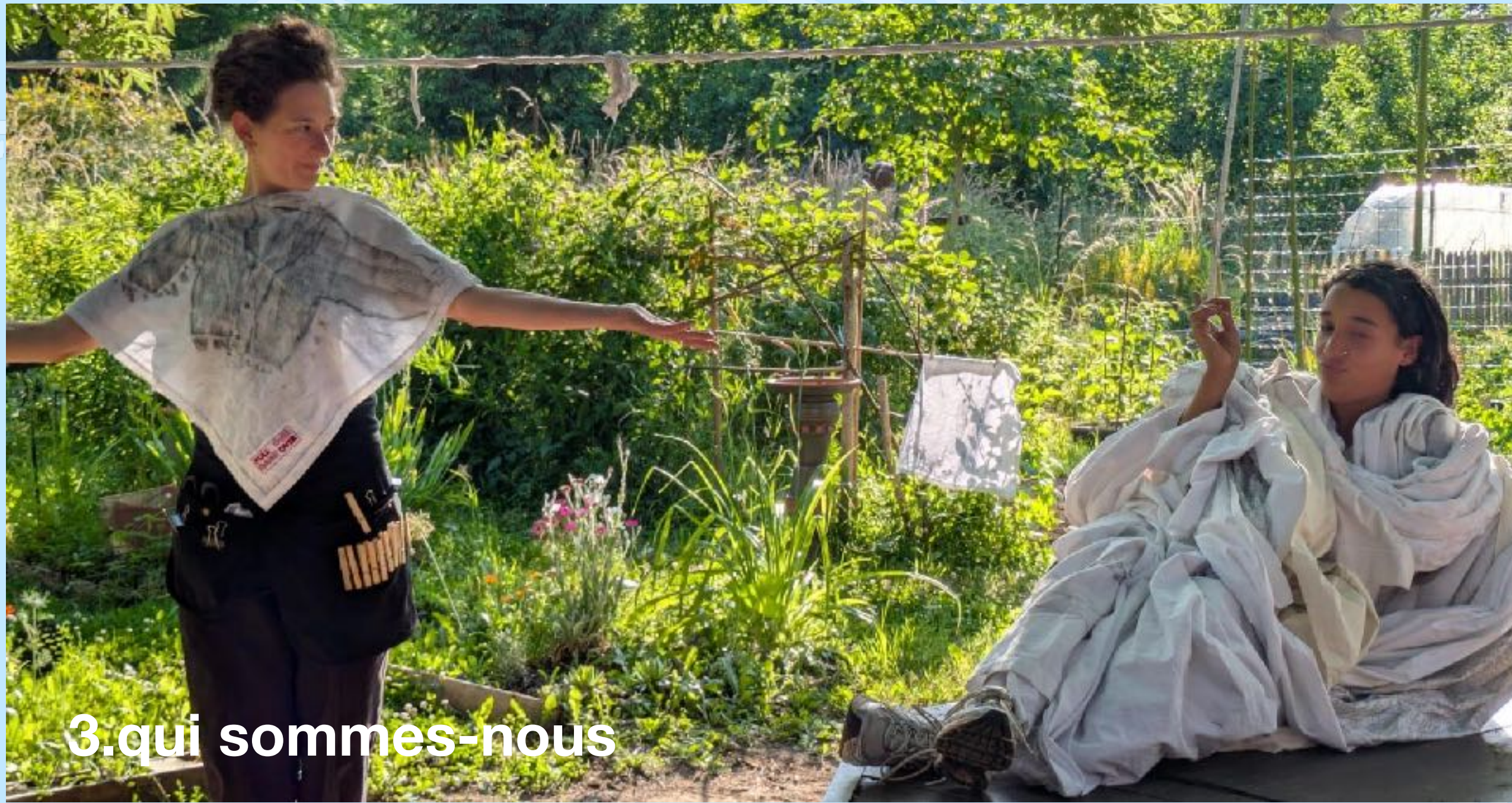
3. qui sommes-nous